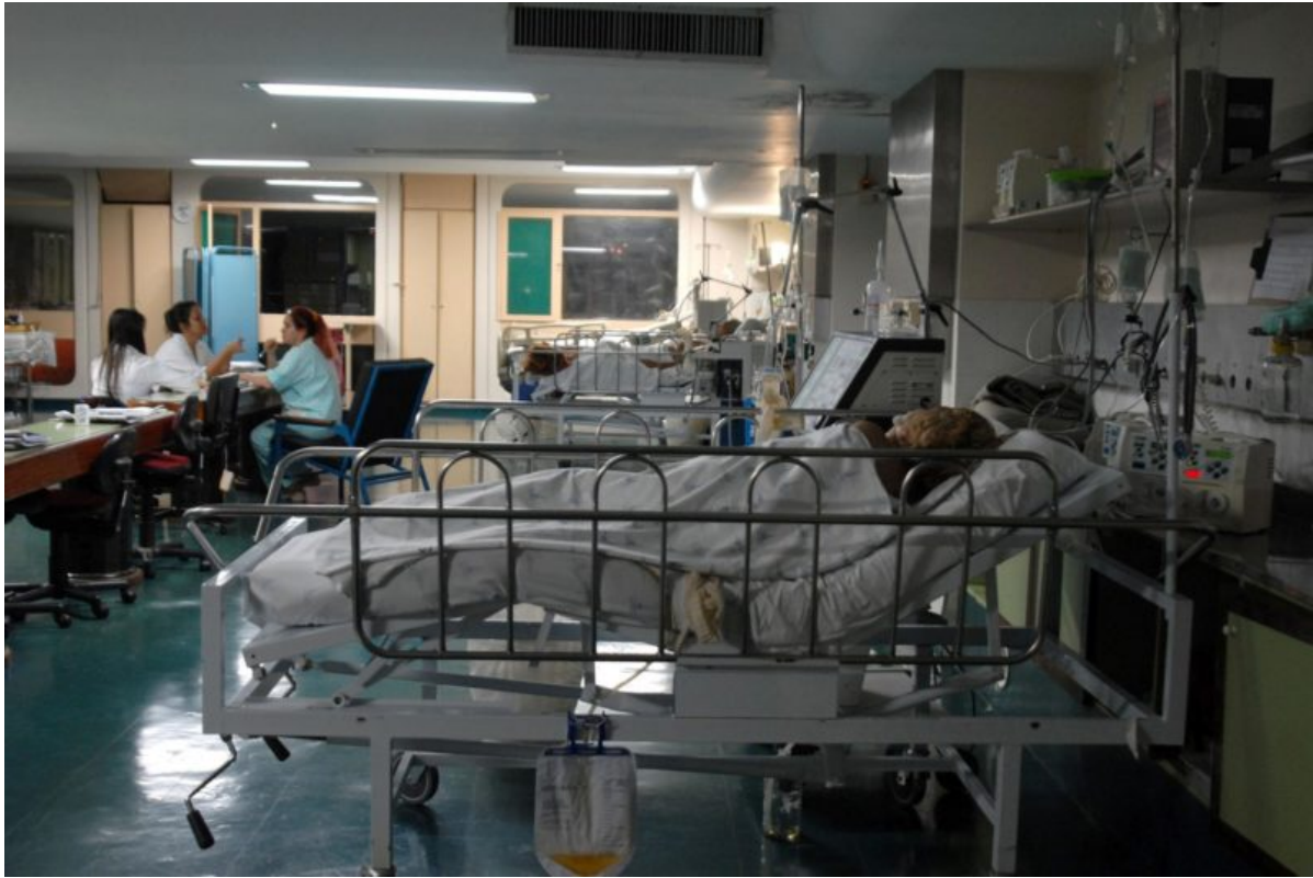
Em 2016, 302.610 morreram em hospitais públicos e privados em decorrência dessas “falhas”

Ainda, infecções associadas ao uso de sonda e a de cateter venoso central são causas comuns que poderiam ter sido evitadas, aponta o levantamento.